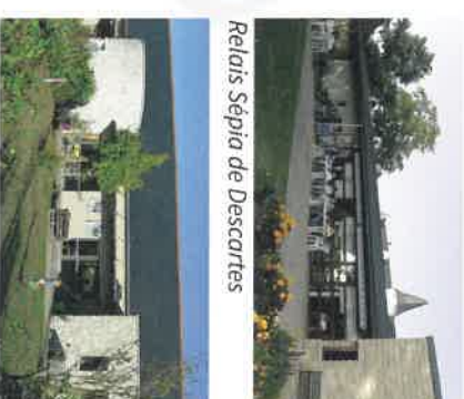
Relais Sépia de Descartes